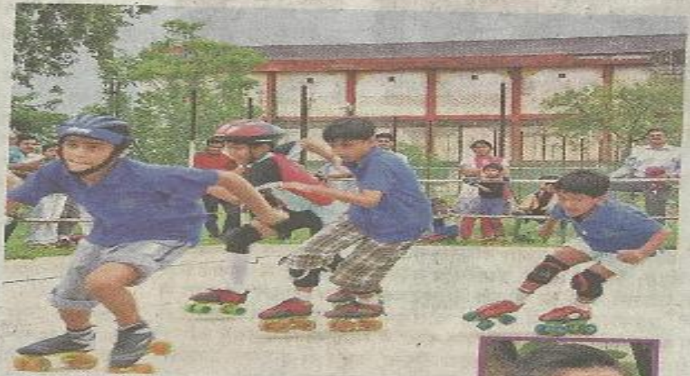
स्केटिंग चैम्पियनशिप में पार्टिसिपेट करते बच्चे।